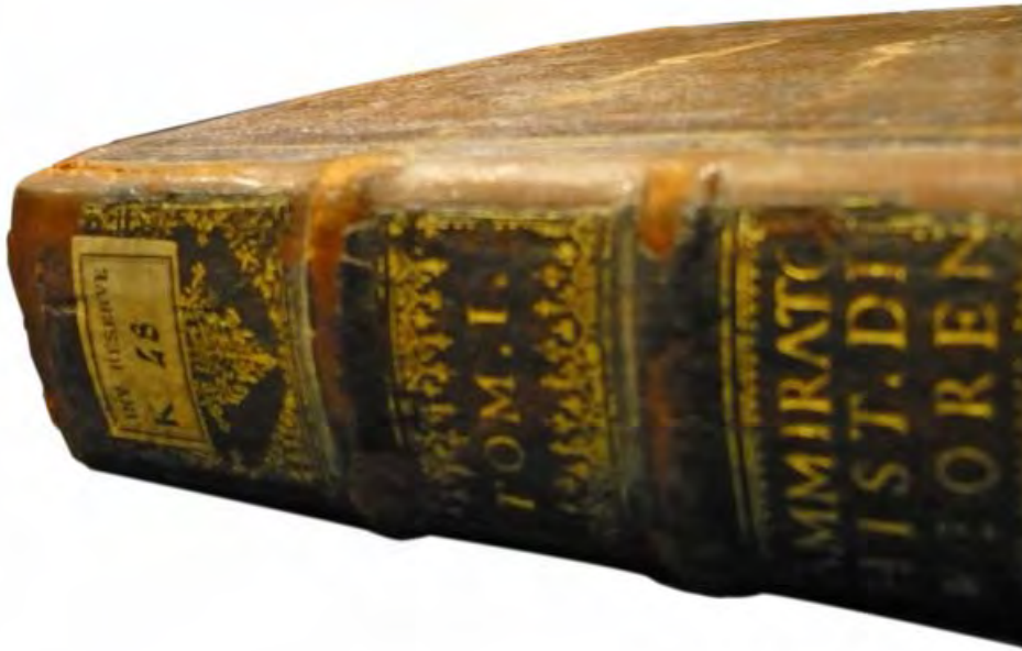
Fig. 5 RES- K- 48, partie supérieure du plat, incrustation de basane neuve visible sur les mors et les nerfs.