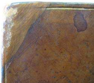
figure 6. avant

Les coins : un cataplasme de colle d'amidon est déposé à la surface de la basane. Une fois humidifiée, la peau est décollée laissant apparaître le coin d'origine dont la peau est en très bon état de conservation (FIG. 6 et 7).