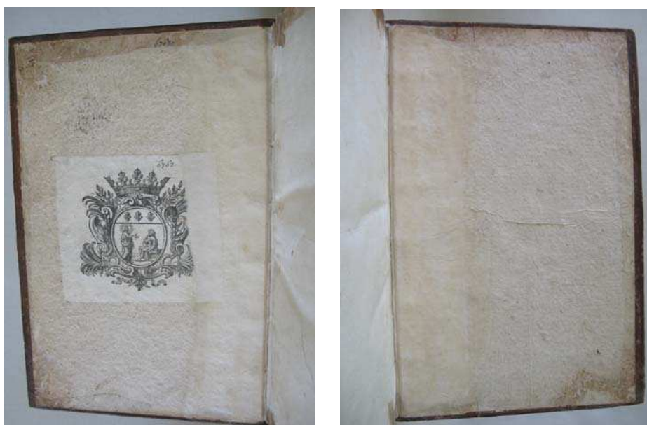
figure 16. contreplats supérieur et inférieur après restauration.

Sur le dos, du papier japonais fin 28 g est collé directement sur les restes de claires anciennes. Ce papier évite un collage direct entre les claires d'origine et celles qui sont ajoutées. Des fragments de fils de couleurs rose et bleue provenant des anciennes tranchefiles ont été retrouvés dans certains fonds de cahiers. De nouvelles tranchefiles simples pékinées respectant ces teintes sont confectionnées en tête et en queue de volume (FIG. 17 et 18).