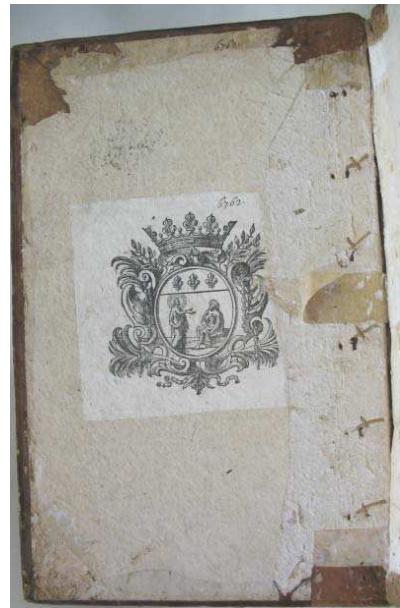
figure 12. contreplat supérieur