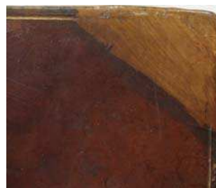
figure 4. restes de teinture

Une trace foncée sur la peau d'origine en veau borde les pièces de basane (FIG. 4). On suppose qu'il s'agit d'un reste de teinture datant de la précédente restauration.