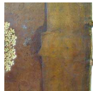
figure 3. plat inférieur