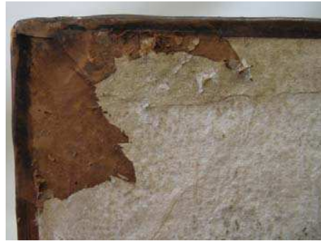
figure 10. après