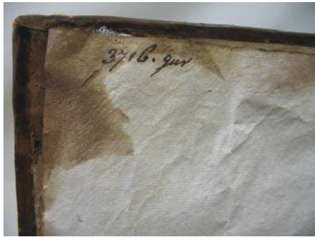
figure 9. avant

Les contregardes : un cataplasme de gel Laponite ® permet l'humidification et le décollage des contregardes (FIG. 9 et 10)