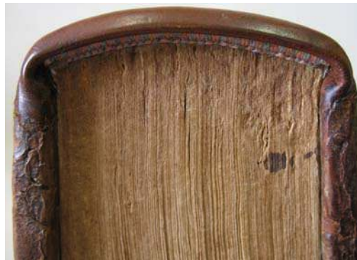
figures 17 et 18. coiffes et tranchefiles de tête et de queue.