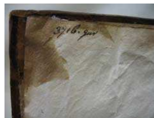
figure 5. ancienne cote manuscrite

Un double feuillet de gardes blanches, datant de la restauration antérieure, est cousu et collé au contreplat supérieur. Il est taché par la dégradation de la peau de basane et porte une cote manuscrite typique du XVI e siècle (FIG. 5).