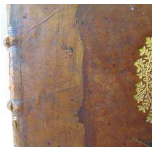
figure 2. plat supérieur

Cette ancienne restauration présente les particularités suivantes : le dos et les coins ont été restaurés à l'aide d'une peau de basane collée sur la peau d'origine. Le dos a été couvert de deux morceaux de peau qui se chevauchent horizontalement sur environ 3 cm entre le 3 e et le 4 e nerf. Cette peau finement parée recouvre les plats sur une largeur irrégulière de 6 cm maximum (FIG. 2 et 3).