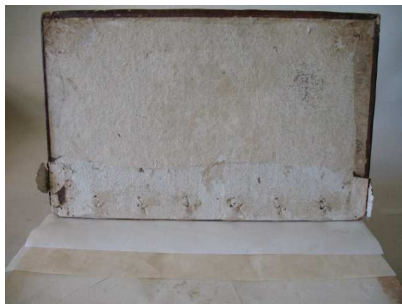
figure 15. plat supérieur fixé : charnière de papier japonais et claie de parchemin