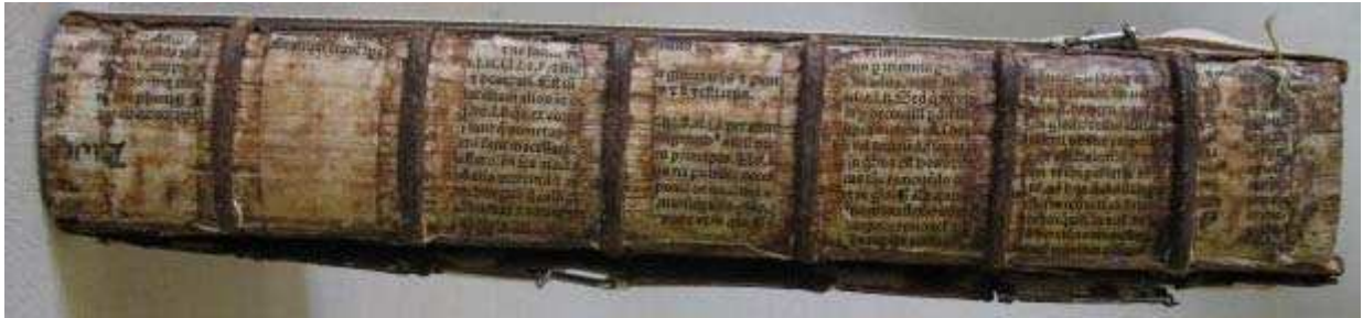
figure 13. claies de parchemin manuscrit.

Sous la basane, le dos d'origine a disparu. Une fois nettoyé des résidus de peau et de colle, on constate le très bon état de conservation de la couture sur lanières de cuir brun. Des claies de parchemin manuscrites posées au XVI e siècle, il ne reste que la partie collée sur le dos. (FIG. 13)