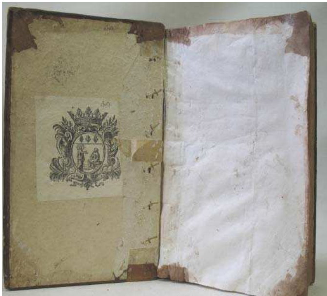
figure 11. contreplat supérieur et sa garde

Le précédent restaurateur n'a pas pris soin de décoller les anciennes gardes. La peau de basane est rempliée sur les gardes d'origine. Les claires anciennes collées aux contreplats ont disparu. Elles ont été décollées, emportant avec elles une large bande de la garde ancienne également collée au contreplat. Seules trois bandes de parchemin ont été ajoutées pour assurer plus de solidité (FIG. 11). Le feuillet ajouté alors masquait : la garde ancienne devenue lacunaire, les remplis, une cote ancienne (6762) et un ex-libris portant la même cote, collé au contreplat supérieur.