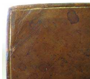
figure 7. après

La même technique est utilisée pour le décollage des mors et du dos (FIG. 8).