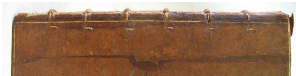
figure 14. ficelles visibles sur le plat et traces de teinture.

Au moment de la précédente restauration, les nerfs, sur lanières de peau de tannage végétal, devaient être rompus le long du mors et les plats détachés. Pour prolonger les nerfs rompus et fixer les plats au corps de l'ouvrage, le précédent restaurateur a fait passer une ficelle sous la base de chacun des nerfs. La ficelle traverse le dos sur deux centimètres et en ressort pour y être collée en éventail, c'est une technique encore couramment utilisée de nos jours.