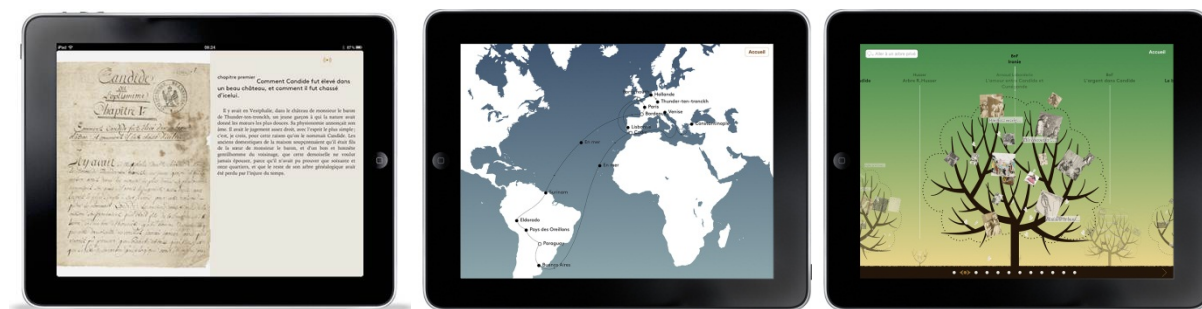
Figure 4 : Candide , l'édition enrichie. Trois entrées dans l'œuvre de Voltaire : le livre, le monde, le jardin.

L'édition numérique enrichie de Candide , publiée par la Bibliothèque nationale de France (BnF), Orange et la Voltaire Foundation, se présente sous la forme d'une application iPad et d'un site web 22 . Elle propose trois entrées dans l'œuvre de Voltaire : le « livre » ou la lecture enrichie, le « monde » ou l'exploration pédagogique, le « jardin » ou l'appropriation des contenus (fig. 4).